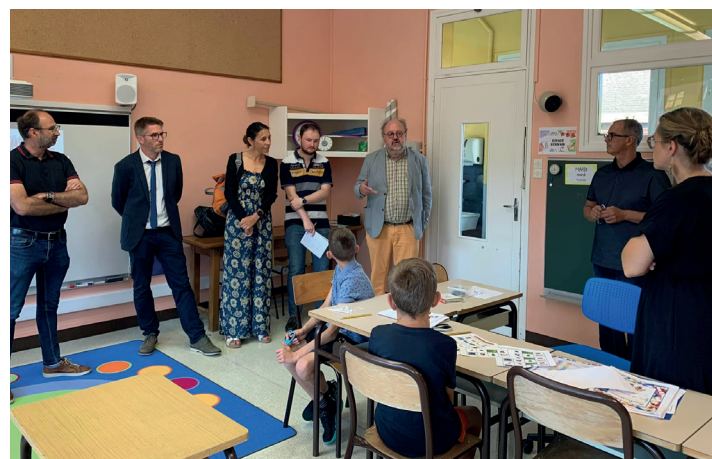
L'école Brocéliande accueille en son sein une Unité d'Enseignement Externalisé pour faciliter l'inclusion de quelques élèves des PEP2S.

Parler d'inclusion, c'est bien, la réaliser, c'est mieux ! La Ville d'Eu le fait et continuera à le faire.