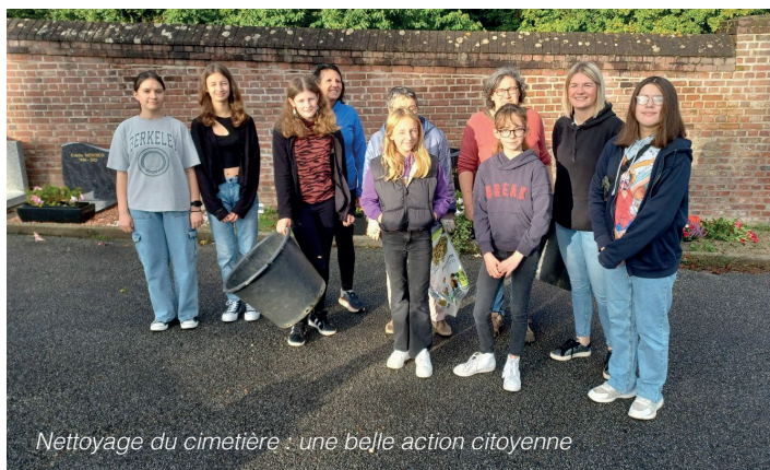
Nettoyage du cimetière : une belle action citoyenne

A l'interdiction d'utiliser des produits phytosanitaires s'ajoute